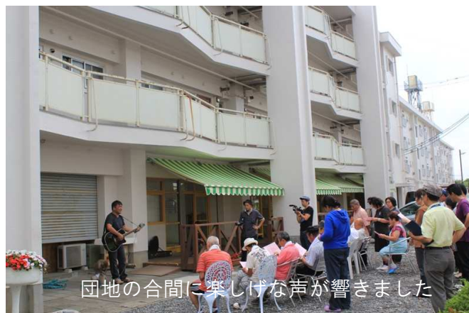
団地の合間に楽しげな声が響きました