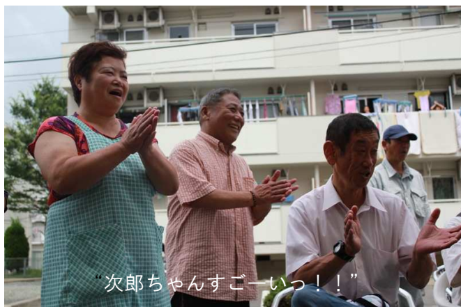
“次郎ちゃんすごーいっ！！”