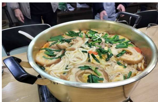
石川のソウルフードとり野菜みそ鍋

能登半島地震に関する報道で、発災時の死者数を上回る関連死者の数をきいて驚きました。自然の脅威に人はなすすべがありませんが、関連死をなくすために、もっと自分たちにできることがあったのではと考えさせられました。今回JDFの活動に参加することで、あたりまえの暮らしをとりもどすために、能登の地でふんばっている多くの方々や、地道に支援を続けられている方や団体に出会うことができました。一人では何もできませんが、JDFの一員として少しでもかかわることができたことに感謝です。折しも石川県知事選挙戦の真っ最中。あたりまえの暮らしのための復興施策の充実を願います。