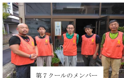
第7クルールのメンバー

第7クール(6/23-6/29)は、初日に豪雨で JR 七尾線が運休となり、支援センターに向かう支援スタッフ5名が、金沢や途中の電車内で立ち往生を強いられるというハプニングで幕を開けました。予定より3時間以上遅れましたが、何とか19時前に、みなさんが支援センターに到着し、活動を始めることが出来ました。