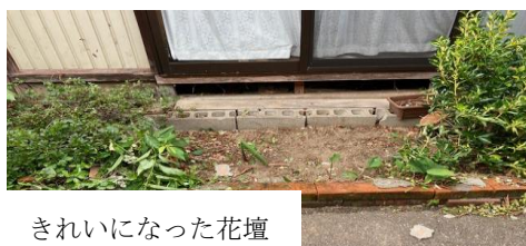
きれいになった花壇