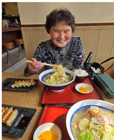
8番ラーメン、おしかったです！