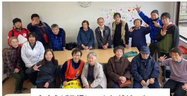
心安らげる場に～やなぎだハウス

「やなぎだハウス」に支援に入らせていただきました。地震に加えての豪雨被害。「私たち何か悪いことをしたんだろうかね」と話されたときには胸が詰まりました。まだまだ復興は遠く、泥水が浸水した床にブルーシートを貼ったままの冷たい作業所で黙々と作業を続けられる利用者さんと、ご自身も被災されながら支え続ける職員の方々。そこに集うことが利用者さんにとってどれだけ大切な場所であるかよくわかりました。1日も早く復旧し、これからも皆さんにとって心安らぐ場所であるよう心からお祈りし、できることで支援ができたと思っています。(兵庫・兵庫県難聴者福祉協会・滝川由里)