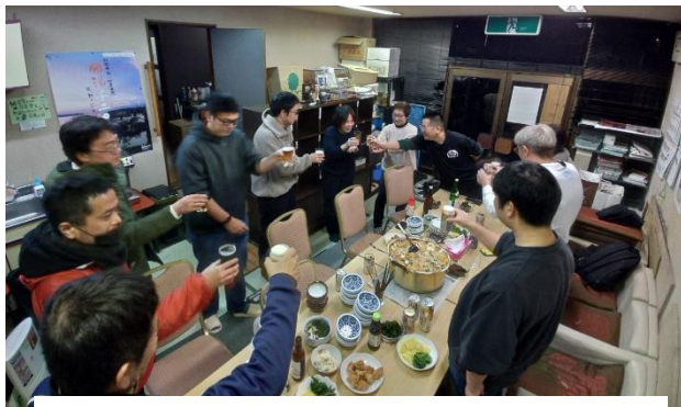
地域の人たち、AARのみなさんと鍋を囲んで